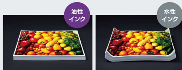
用紙の変形が少ない

用紙が波打ちしないので、安定した用紙搬送が可能となり、後処理加工への移行もスムーズです。