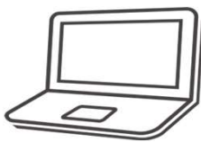
クライアント端末