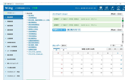
メインメニュー画面